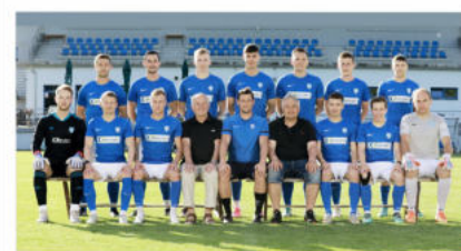
MUŽI B 2022 2023 FK CHLUMEC NAD CIDLINOU