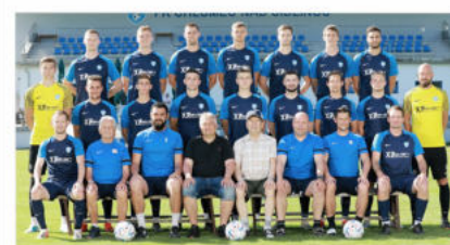
MUŽI A 2022 2023 FK CHLUMEC NAD CIDLINOU

Všechny čtenáře moc zdravím, vaňte si všech dobrovolných funkcionářů v klubech, kteří, většinou i na úkor rodiny, dělají vše pro to, aby se každý víkend mohli hráči a diváci těšit ze svých utkání.